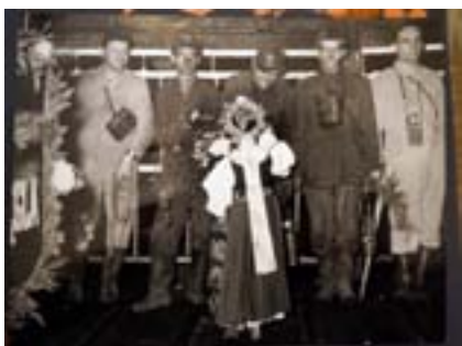
Na kartach kroniki przewijają się wszystkie ważne wydarzenia – dominują rzecz jasna Barbórki.