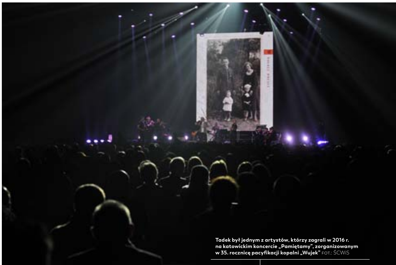
Tadek był jednym z artystów, którzy zagrali w 2016 r. na katowickim koncercie „Pamiętamy”, zorganizowanym w 35. rocznicę pacyfikacji kopalni „Wujek”

Sala teatralna w Pałacu Młodzieży może pomieścić 420 osób, w związku z tym przedstawiciele szkół, które są zainteresowane udziałem w spotkaniu, muszą zgłaszać się do organizatora, czyli Śląskiego Centrum Wolności i Solidarności.