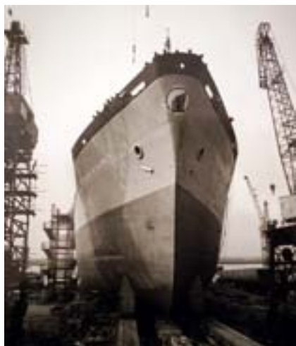
Kopalnia „Mysłowice” ma nawet statek swojego imienia...