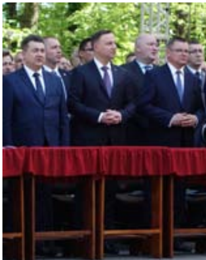
Wśród pielgrzymów był Andrzej Duda, Prezydent RP. Na zdjęciu w towarzystwie Grzegorza Tobiszowskiego i Jerzego Polaczka

W swoim wystąpieniu wspominał również o kwestii trzeźwości, przypominając, że rok 2017 jest – z woli Sejmu – rokiem troski o trzeźwość narodu. Zaapelował o ustawy zakaz reklamy alkoholu w mediach i o rewizję wszystkich koncesji na sprzedaż alkoholu.