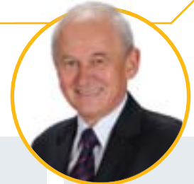
KRZYSZTOF TCHÓRZEWSKI, minister energii

Polska Grupa Górnicza zakończyła pierwszy rok swego funkcjonowania. Ma również za sobą połączenie z Katowickim Holdingiem Węglowym. Pojawiły się też nowe problemy, którym należy stawić czoła. Nie został rozwiązany problem Układu zbiorowego, trzeba to będzie wszystko uregulować. Dobrze wychodzi sprawa wewnętrznej organizacji. To oznacza, że decyzja co do sposobu restrukturyzacji była słuszna. Z jednej strony restrukturyzacja zadłużenia, z drugiej dokapitalizowanie. Rozłożenie procesu dokapitalizowania w czasie powoduje, że nie ma parcia na szybkie wykorzystanie środków. Polska Grupa Górnicza jest tym samym zainteresowana, ażeby wypracowywać swoje własne środki i to powoduje mobilizację wewnętrzną. Zarówno załoga, jak i kierownictwo, poczynając od zarządu do niższych szczebli, wykazują duże ambicje osiągnięcia sukcesu To mnie bardzo cieszy. Wyszedł nam też naprzeciw układ cen węgla. One zmieniły się na korzyść PGG. Przy cenach z przełomu klat 2015/2016 było by znacznie trudniej działać. Myślę, że jeśli chodzi o pion węglowy, to będzie to najlepsza spółka w Europie