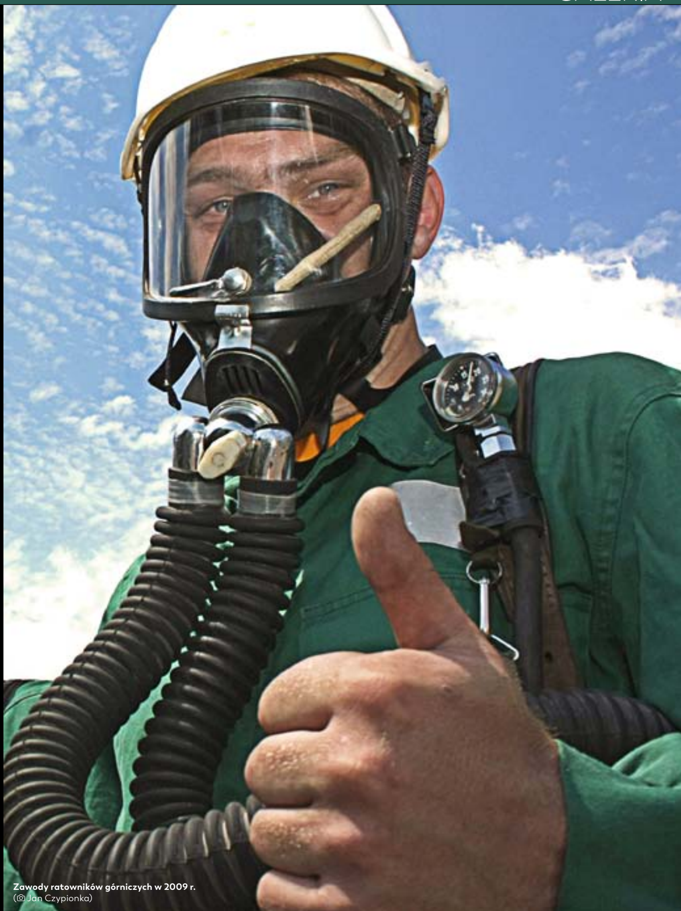
Zawody ratowników górniczych w 2009 r.