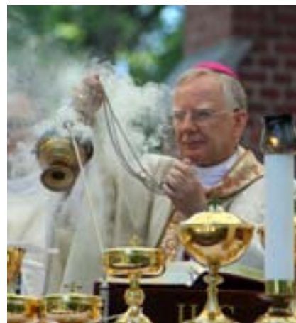
Kulminacją pielgrzymki była msza święta, której przewodniczył metropolita krakowski arcybiskup Marek Jędraszewski

kobiet, pracujących – wykonujących prace niekonieczne – w niedziele i dni świąteczne. Podkreśla też wartość niedzieli, jako dobra kulturowego i dnia wolnego od pracy.