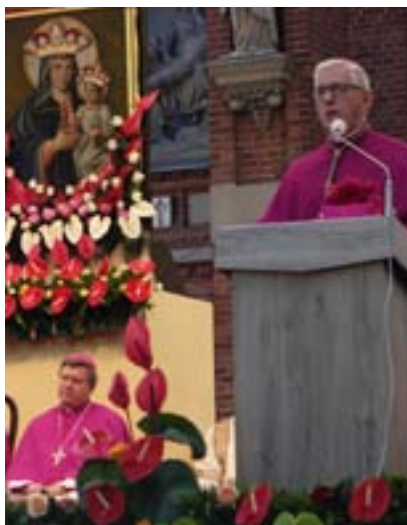
Pielgrzymów powitał arcybiskup Wiktor Skworec, metropolita katowicki.

– W waszym imieniu witam – jako pielgrzymka – prezydenta Rzeczypospolitej Polskiej, pana Andrzeja Dudę. Panie Prezydencie, witamy i dziękujemy za obecność w Katowicach w dniu 4 kwietnia, w celu podpisania ustawy o związku metropolitalnym