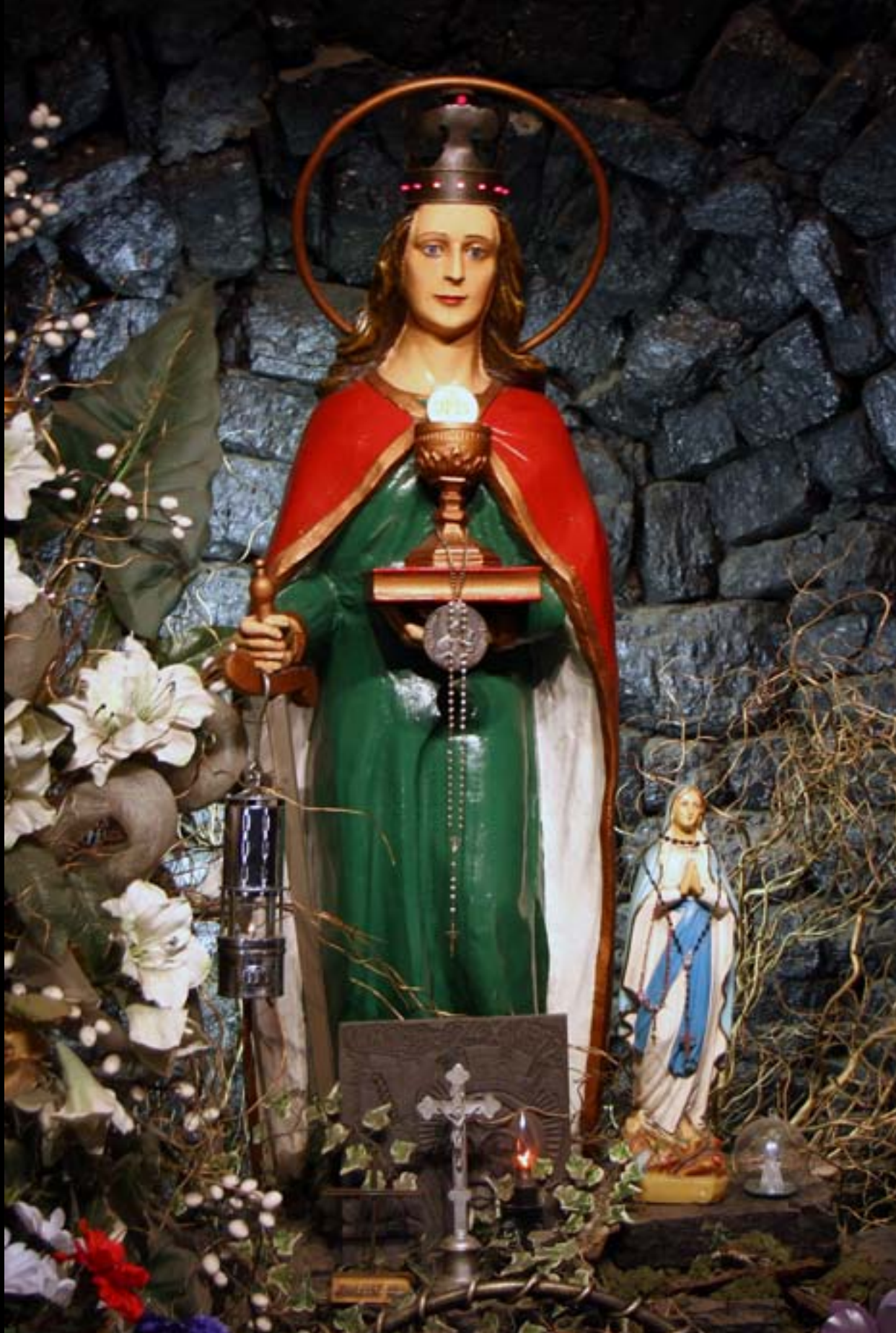
Ołtarz świętej Barbary w cechowni kopalni „Piast-Ziemowit” ruch „Ziemowit”.