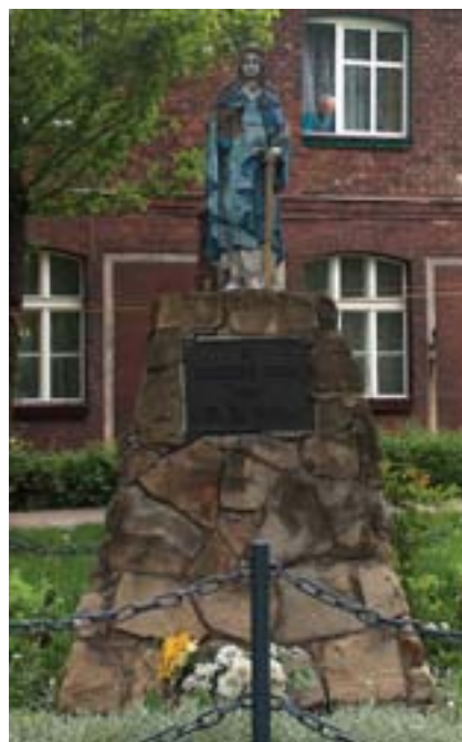
Ta figurka świętej Barbary pochodzi z 1933 r.