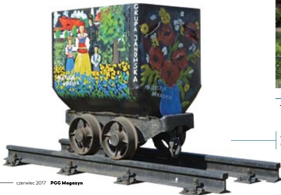
W Giszowcu pamiątkowy wagonik uwiecznia twórczość Grupy Janowskiej