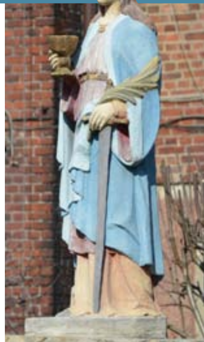
W 2014 przy ul. Kopalnianej w Katowicach odsłonięto figurkę św. Barbary, odrestaurowaną staraniem KHW