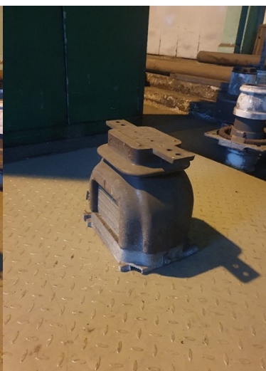
około 25 x 30kg