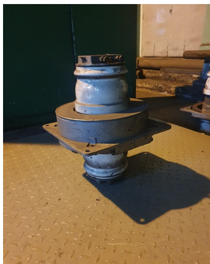
około 61 x 22kg