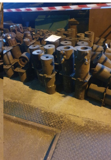
około 92 x 42kg