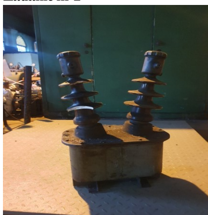
około 6 x 60kg