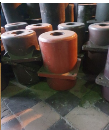
około 13 x 18kg