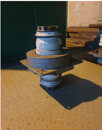
około 61 x 22kg