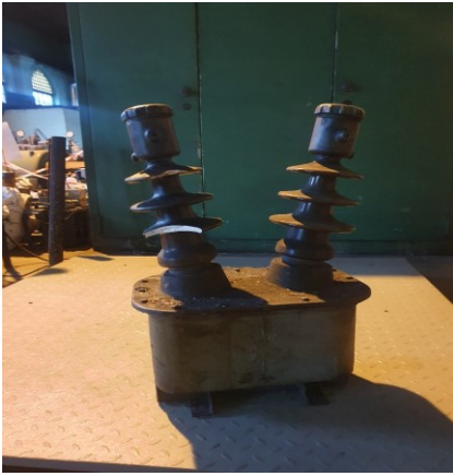
około 6 x 60kg