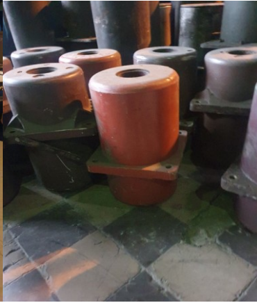
około 13 x 18kg