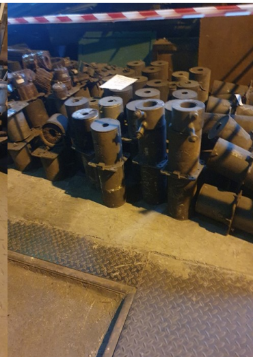
około 92 x 42kg