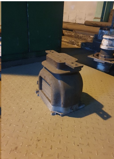
około 25 x 30kg