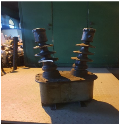
około 6 x 60kg