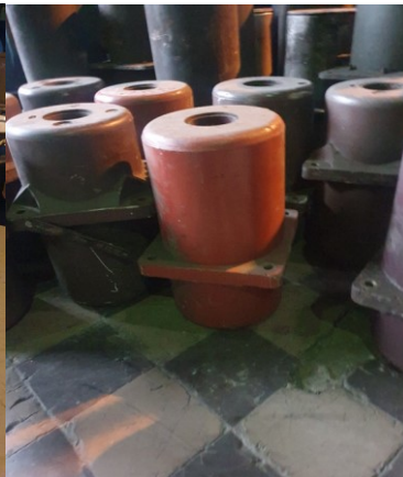
około 13 x 18kg