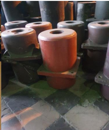
około 13 x 18kg