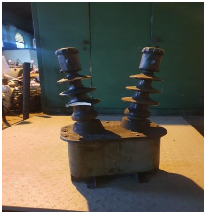
około 6 x 60kg