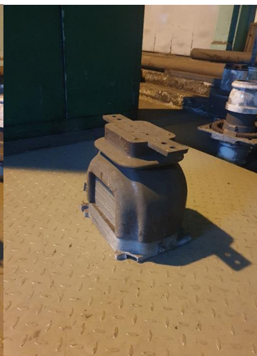
około 25 x 30kg