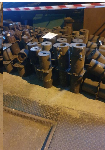
około 92 x 42kg