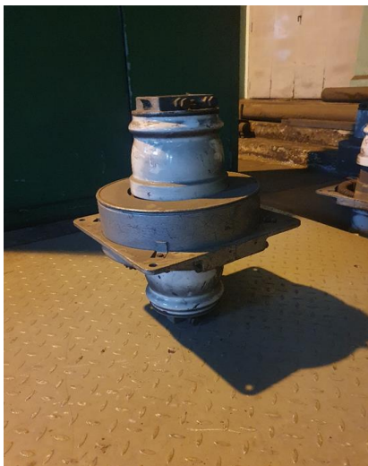
około 61 x 22kg